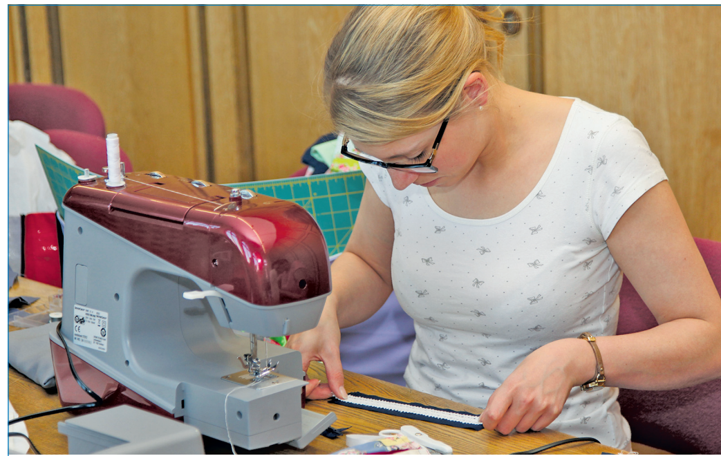
Kreatives Schneiden: auch ein Kursangebot der VHS

Im Fachbereich Kreativität warten Mal- und Zeichenkurse auf Interessierte. Dabei gibt es Zeichengrundkurse, Kurse zur Drucktechnik, Radierung sowie Malen mit Acrylfarben oder Aquarell. Neben den grundlegenden Fototechniken gibt es im Bereich Fotografie Seminare zu den Themen Portrait-, Sport- und Erotische Fotografie. Im