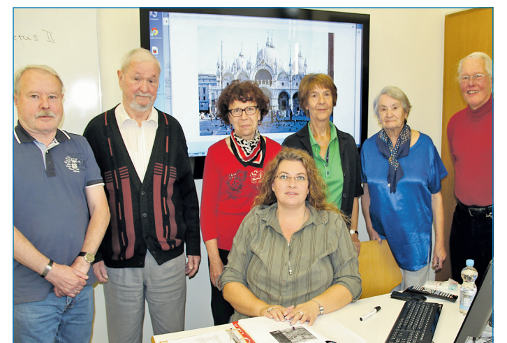
Sprachen lernen in der VHS-Seniorenakademie

Klaus Lorig Oberbürgermeister der Stadt Völklingen